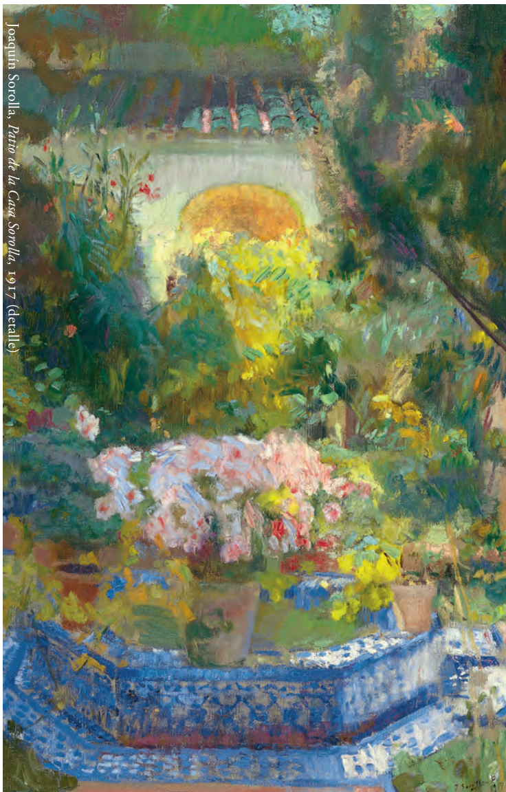
Joaquín Sorolla, Patio de la Casa Sorolla , 1917 (detalle)